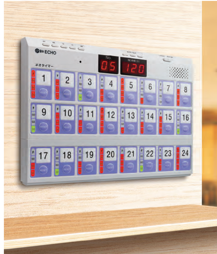
オプションモデル増設設置イメージ